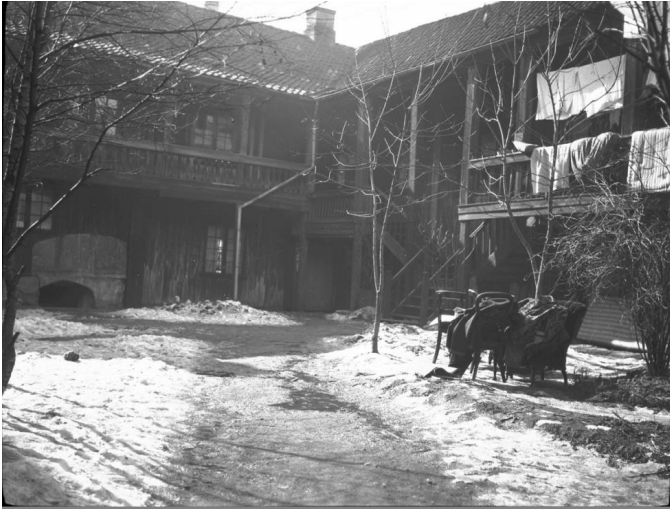
Grønland gamle hjem (nåværende Asylet) 1921. Foto Caroline Colditz. Oslo Museum. (Fri bruk)

Boligbyggingen hadde nærmest eksplodert, men det var en type boligbygging som hadde skapt trangboddhet og dårlige levekår. Om kommunale midler var knappe på 1800-tallet ble det enda vanskeligere etter unionsoppløsningen i 1905 og så kommer første verdenskrig, dyrtid og de harde 30-årene. Diskusjonen startet allerede på 1920-tallet om man skulle rehabilitere eller rive områder av Oslo. Og rivningen startet allerede på slutten av 30-tallet i området