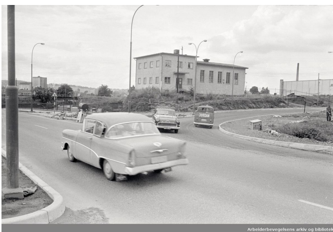
Laura (Lørenhallen) forsamlingshus og kino.

« Laura » (eller «Lauar'n») Lørenhallen kino var en privat eid kino. Vi kalte den «Laura». Andre i områdene sa «Lauar'n». Kinoen hadde forestillinger hver