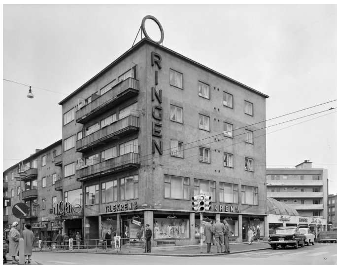
Ringen kino på Carl Berners plass.

På 1950-, 1960- og 1970-årene var det flere kinoer i vårt nærområde. Riktignok var det ingen innen det som vi nå omtaler som EGT-området, men det var kinoer rundt i randsonen. Det var populært å gå på disse kinoene i barne- og ungdomstiden. Flere kinoer lå i gangavstand eller kunne nås på sykkel. Det var forholdsvis kort vei til Jarlen kino, Ringen kino, Sinsen kino og «Laura», Litt lengre var det til Soria Moria, Parkteatret, og Sentrum kino. Du lurer kanskje på hva «Laura» var og lå? Det kommer om litt!