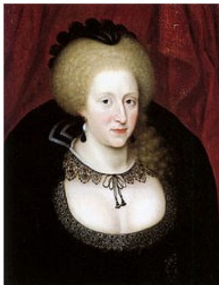
Anne av Danmark i sorg. Ca 1612. National Portrait Gallery

tilbake var omsider danske og skotske sendemenn i København blitt enige om en ekteskapskontrakt mellom den sittende skotske konge og yngste datter til den salige (avdøde) dansk-norske kongen Fredrik II (d. 1588). Det var ikke småting de over lang tid hadde