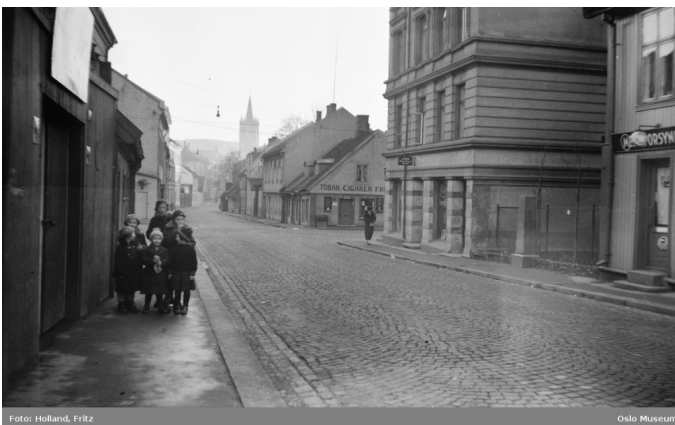
Norbygata ved Motzfeldts gate og bauta for Ole Gudmundsen. 1937. Foto: Fritz Holland. Oslo Museum. (Fri bruk).

Boligbyggingen hadde nærmest eksplodert, men det var en type boligbygging som hadde skapt trangboddhet og dårlige levekår. Om kommunale midler var knappe på 1800-tallet ble det enda vanskeligere etter unionsoppløsningen i 1905 og så kommer første verdenskrig, dyrtid og de harde 30-årene. Diskusjonen startet allerede på 1920-tallet om man skulle rehabilitere eller rive områder av Oslo. Og rivningen startet allerede på slutten av 30-tallet i området