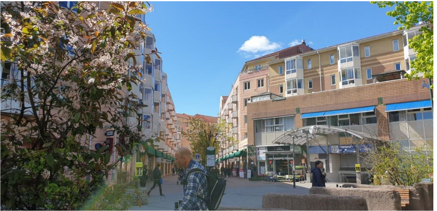
Grønland Torg, Smalgangen 2020.

dustri, handel- og håndverksbedrifter helt opp til den utenlandske innvandringen skjøt fart for 50 år siden. Etter den tid har mangfoldet utviklet seg, og det er neppe noe annet sted i Norge at man på et såpass lite område kan møte så mange forskjellige folkeslag og kulturer. - Og det er alt dette jeg nå brenner for.