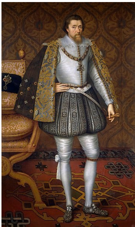
James 6 og 1 av England malt av John de Critz ca. 1605. Museo de Prado.