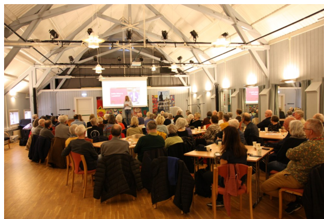
En lyttende forsamling til Aslak Sira Myhres foredrag.

mest profilerte foredragsholder vi har hatt i EGTs historie. Dette «scoopet» er vi veldig glade for – og ikke så lite stolte over, heller. 60 tilhørere lyttet intenst i 1 time. Takk til Sira Myhre.