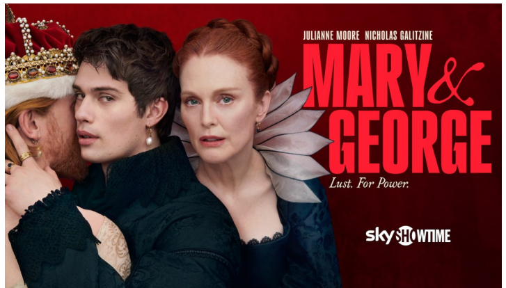
Serien Mary & James.

Reformasjonen i 1537 førte til dramatiske endringer på flere hold. Alle Norges biskoper ble avsatt og alt kirkegods inndratt av kongen. Nesten hele Oslos bispeborg ble revet, bare "tårnet og stenhuset inntil" fikk stå. Disse ble senere brukt som grunnmur for borgermester Christen Mules renessansehus, som tok form omkring 1579. Vi vet ikke så mye om hvordan denne bygningen så ut, men den må ha vært ganske staselig.