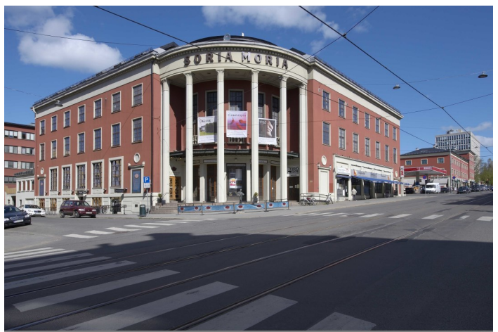
Soria Moria.

Alle tre var premierekinoer med repertoar som Tatt